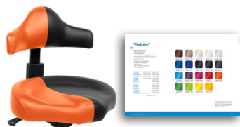
„PeriLine“ Seite 105

Standardfarbe Schwarz Art. Nr.: 3037 0235