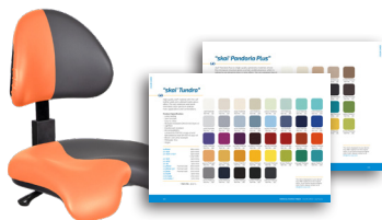
„skai Tundra“ Seite 102 „skai Pandora Plus“ Seite 103

Standardfarbe Anthrazit Art. Nr.: 3037 0052